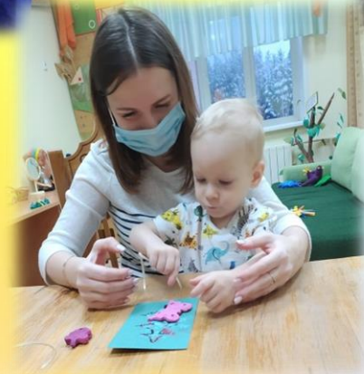
развития мелкой моторики