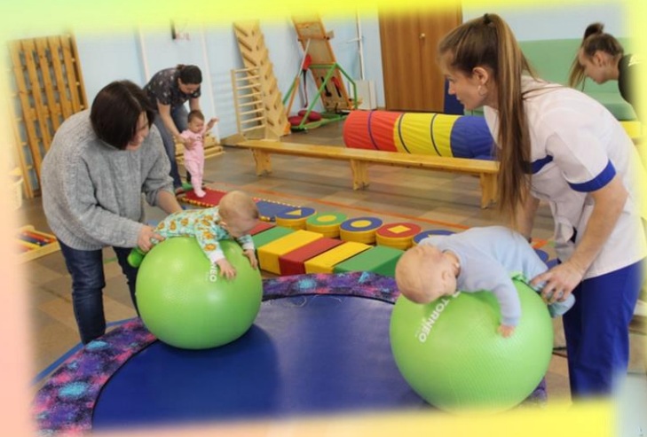
формирование физической активности

Это психолого-педагогическая и медико-социальная помощь детям от рождения до трех лет, направленная на выявление особенностей и нарушений развития, предотвращение и раннюю коррекцию их возможных последствий.