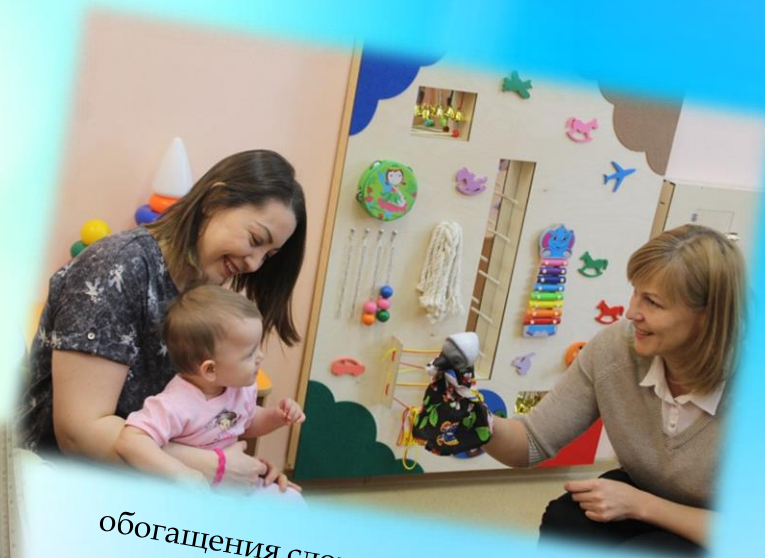
обогащения словарного запаса